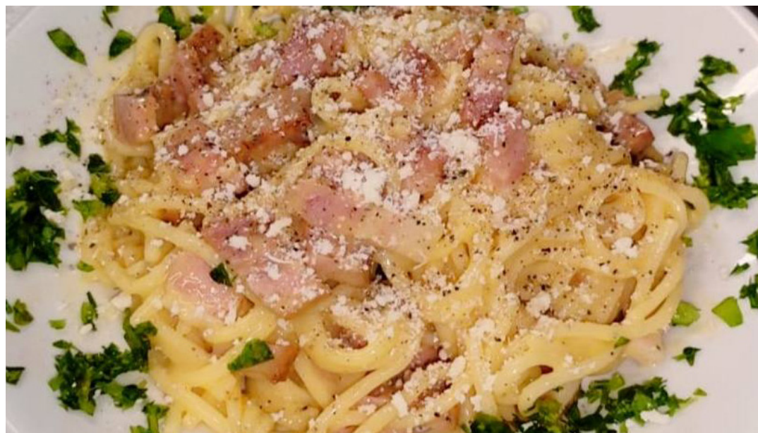
Gli spaghetti alla carbonara serviti ai nostri come prima portata nel giorno di Santa Lucia

Anche quest'anno, la Casa di Riposo ha deciso di proporre ai suoi ospiti dei menu speciali per le festività natalizie, a parte dalla festa dell'Immacolata, quando sono stati serviti risotto con salsiccia, zucca e gorgonzola dolce Dop e poi luganega in umido con polenta, accompagnata da cipolla bianca al forno con salsa agrodolce. Per Santa Lucia, invece, ecco gli spaghetti alla carbonara, seguiti da fettine di lonza con pancetta e formaggio fuso con l'aggiunta di un tris di legumi in umido come contorno e, a conclusione, le frolle di Santa Lucia come dolce. Ma non finisce qui, perché ci sarà un fantastico tritico tra la Vigilia e Santo Stefano, che vedrà la cucina proporre bigoli di pasta fresca in salsa di acciughe, baccalà (nasello) alla vicentina con polenta e carciofi trifolati il 24 dicembre. Quindi, per il